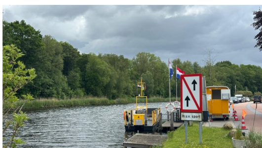
Foto's Pont Ome Piet AT5