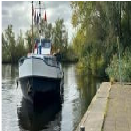
Foto: De andere pont, de Helena

Er is nog een pont die naar het Amsterdamse Bos vaart, de Helena op de Nieuwe Meer. Maar die dreigt dit jaar ook te verdwijnen, doordat de subsidie in principe na 2026 stopt. Dat betekent dat de kans groot is dat er vanaf 2027 geen enkele pont meer van en naar het bos zal varen.