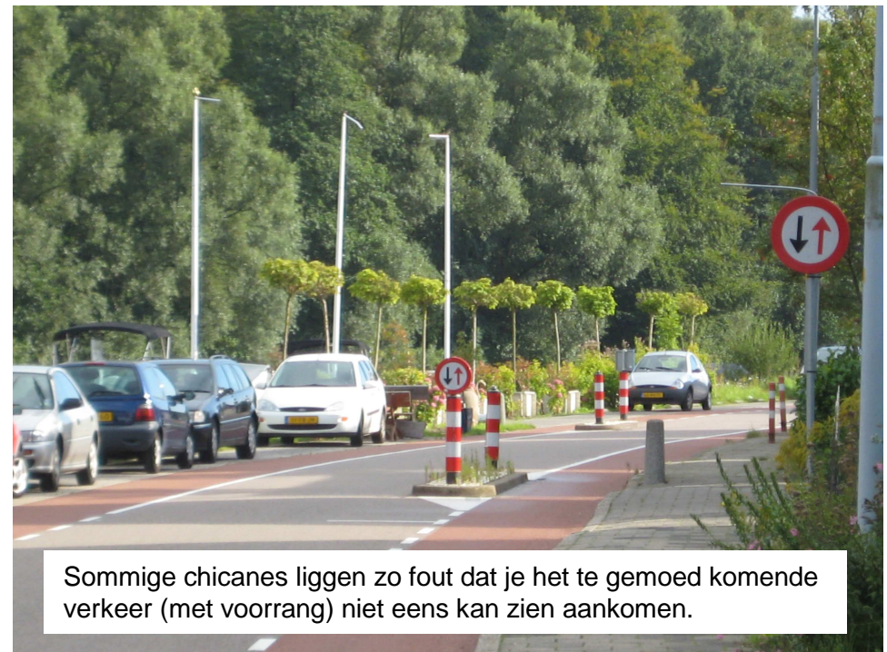
Sommige chicanes liggen zo fout dat je het te gemoed komende verkeer (met voorrang) niet eens kan zien aankomen.

De maatregelen tegen sluipverkeer en te hard rijden (30 km inrichting) hebben de veiligheid ten spijt niet (echt) geholpen, de chicanes hebben aantoonbaar geleid tot veel meer ongevallen, met vooral (brom)fietsers, zie het overzicht met ongevallen op onze website. Hopelijk brengt het Deltaplan bereikbaarheid hier heel snel verandering in.