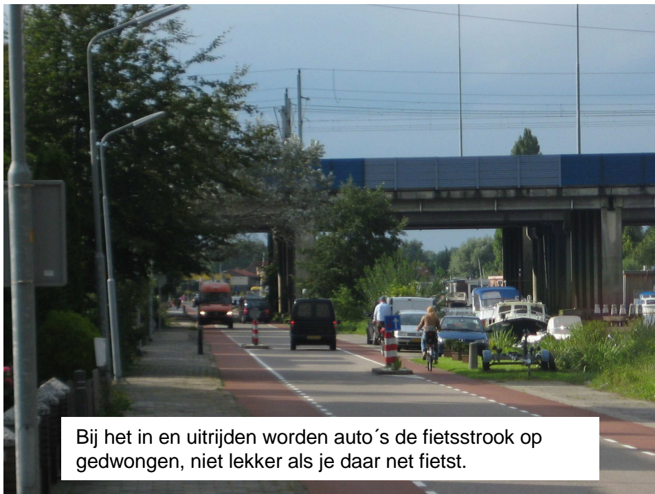
Bij het in en uitrijden worden auto's de fietsstrook op gedwongen, niet lekker als je daar net fietst.