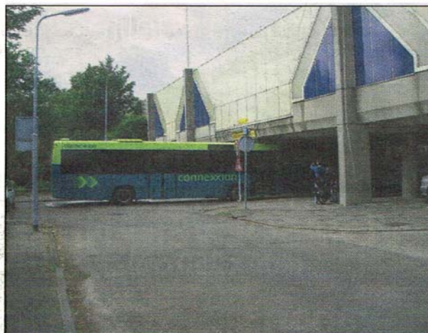
Binnenkort zullen dit soort beelden tot het verleden horen.

In 2000 pleit de gemeente Haarlemmermeer voor een nieuwe variant: omlegging van de A9. In 2005 trekt het platform A9om! de provincie over de streep en de rest volgt: in oktober van dat jaar wordt de overeenkomst ondertekend. De A9 gaat om! Na acht jaar van overleg, plannenmakerij en participatie gaat in 2013 de omlegging daadwerkelijk van start.