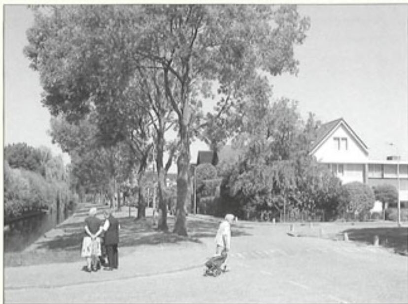
Keizersweg op de kruising met de Marconistraat en rechts de Chr. Huygensstraat, 2009.

De Koekoekslaan liep oorspronkelijk vanaf de Ringvaart door naar de Meidoornweg; de weg loopt nu dood bij het viaduct van de uit Amsterdam komende Oude Haagseweg.