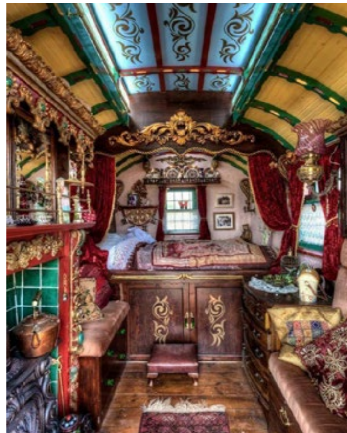
TINY HOUSES · CIRCULAIR BOUWEN · ZELFBOUW