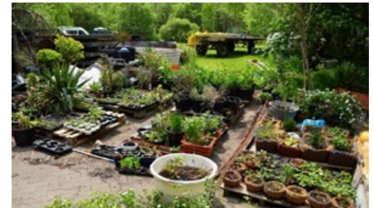
NATUUR & PERMACULTUUR