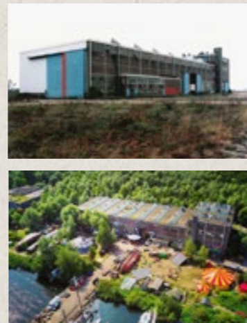
vergroening: toen en nu